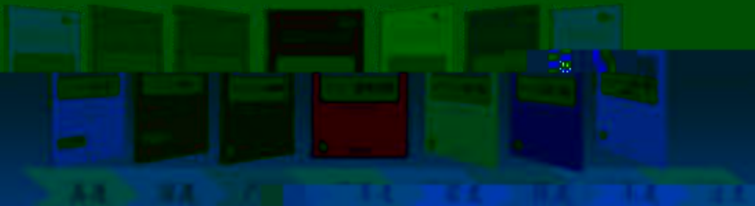
一体化课程教学设计 综合实训基地